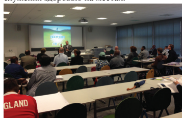
участники тренинга ARMin в Женеве

Первый тренинг ARMin для руководителей из разных стран прошёл в Женеве, Швейцария, где более 1000 участников собрались на вторую Всемирную Конференцию по здоровью и здоровому образу жизни. Более 30 участников прошли 3-дневный интенсивный курс, позволяющий открывать подобные отделы служения здоровью на местах.