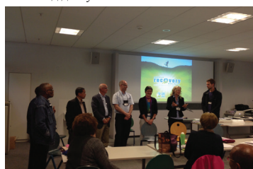
Participants simulate a 12-Step group and talk about their experiences.

Каждую субботу утром с 8:00 до 8:30 по восточному поясному времени служба «Into HIS Rest» («Опираясь на Него») устраивает селекторную телефонную конференцию, главной темой которой является выздоровление, обусловленное эмоциональным исцелением. Конференции начались приблизительно год назад и проводятся одним или несколькими специалистами в области выздоровления. Каждая передача начинается с молитвы. Первые 15 минут ведущий рассказывает о том, как библейские понятия согласуются с выздоровлением. Заключительные 15 минут посвящены ответам на вопросы участников и комментариям. Занятие также заканчивается молитвой. Любой желающий присоединиться к конференциям, может сделать это, позвонив по телефону (712) 432-3066. Код доступа: 203255.